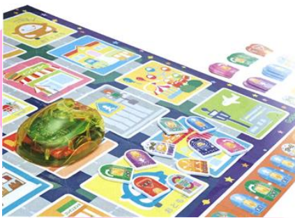
— オリジナルカード(スーパーマーケット編) —

プログラミングカーを使って、 いろいろなミッションを達成させよう！！ 動物にあいさつしたり、おいしいカレーを 作ったりすることができるよ。